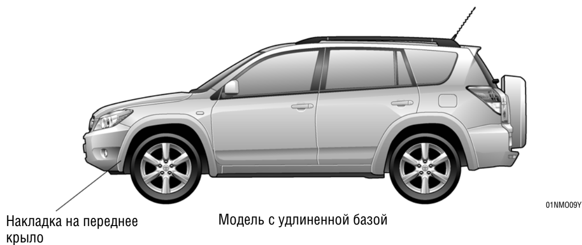
Модель с удлиненной базой