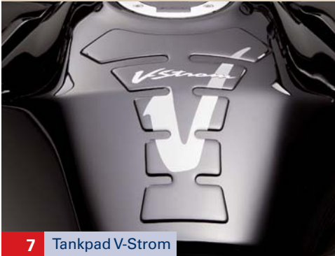
7 Tankpad V-Strom