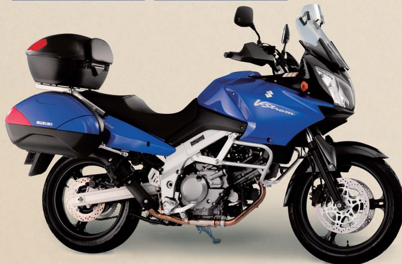
23 Niedrige Sitzbank (Modell 2004)