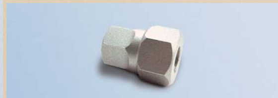
13 Sechskantbit für Vorderradachse