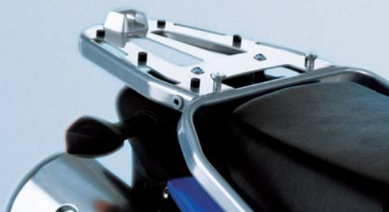
14 Top-Case Träger