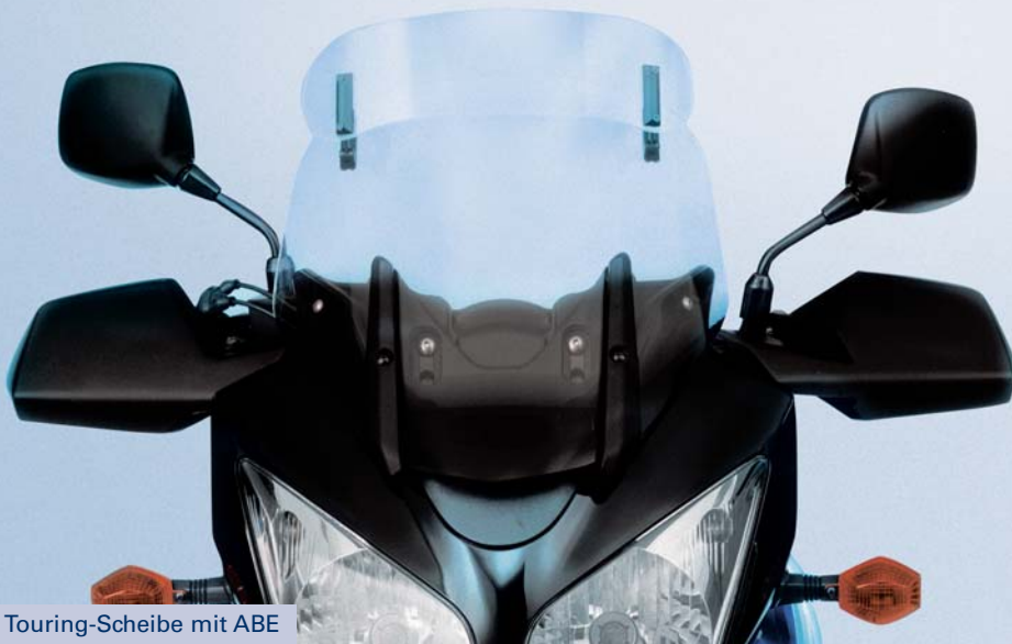
1 Touring-Scheibe mit ABE