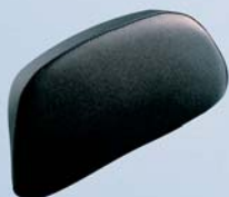
15 Rückenpolster für Top-Case, 48 L