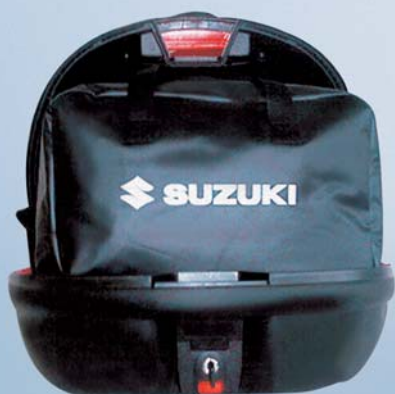
16 Innentasche für Top-Case, 48 L