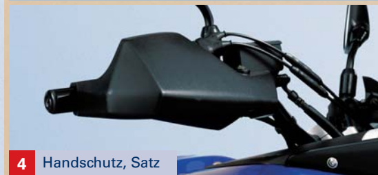
4 Handschutz, Satz