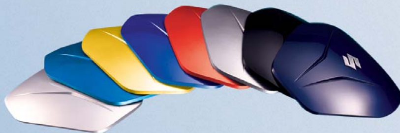
17 Abdeckung für Topcase, 48 L