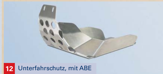
12 Unterfahrschutz, mit ABE