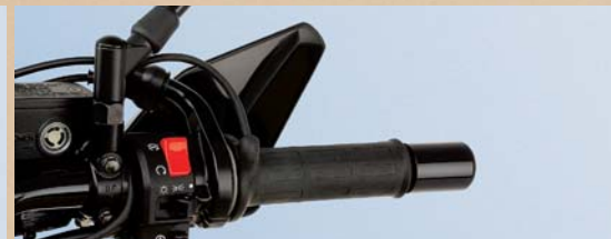
5 Griff-Heizung mit regelbarem Thermostat