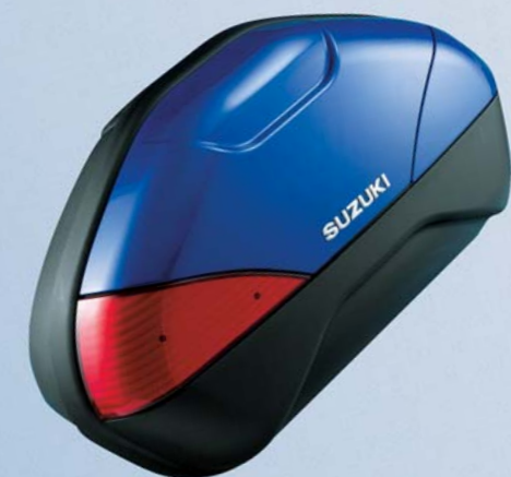
21 Mittlere und seitliche Kofferabdeckung Seitenkoffer, Satz