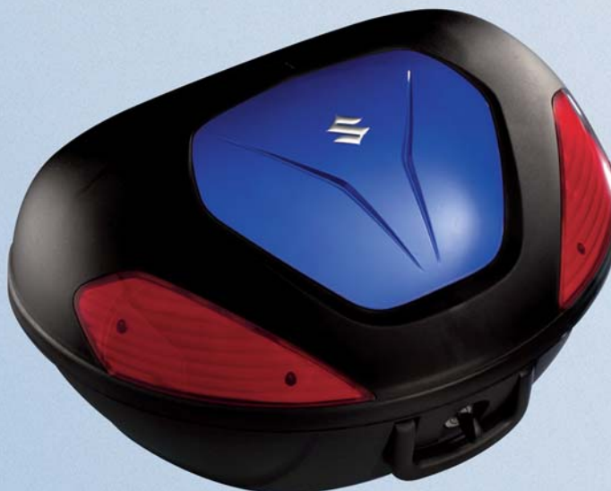
18 Top-Case, 48 L