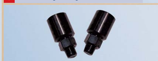
6 Spiegelverlängerung, Satz