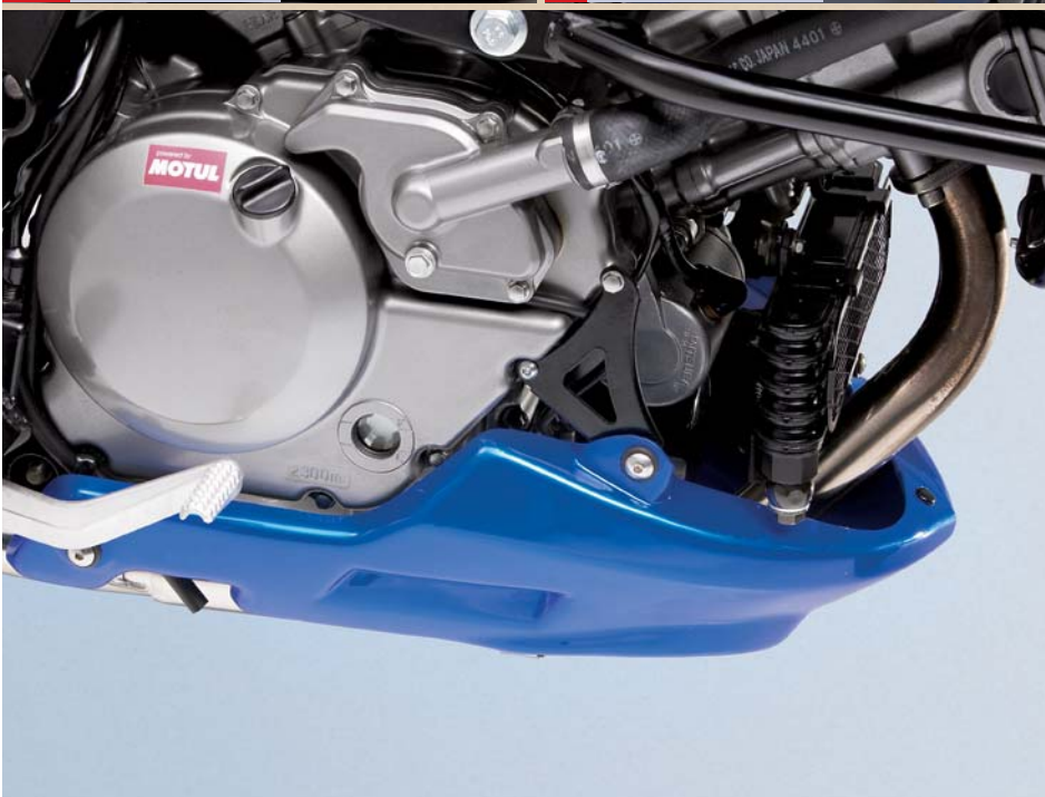
9 Bugspoiler, mit ABE