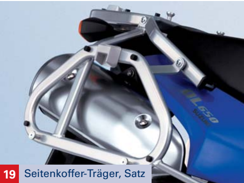
19 Seitenkoffer-Träger, Satz