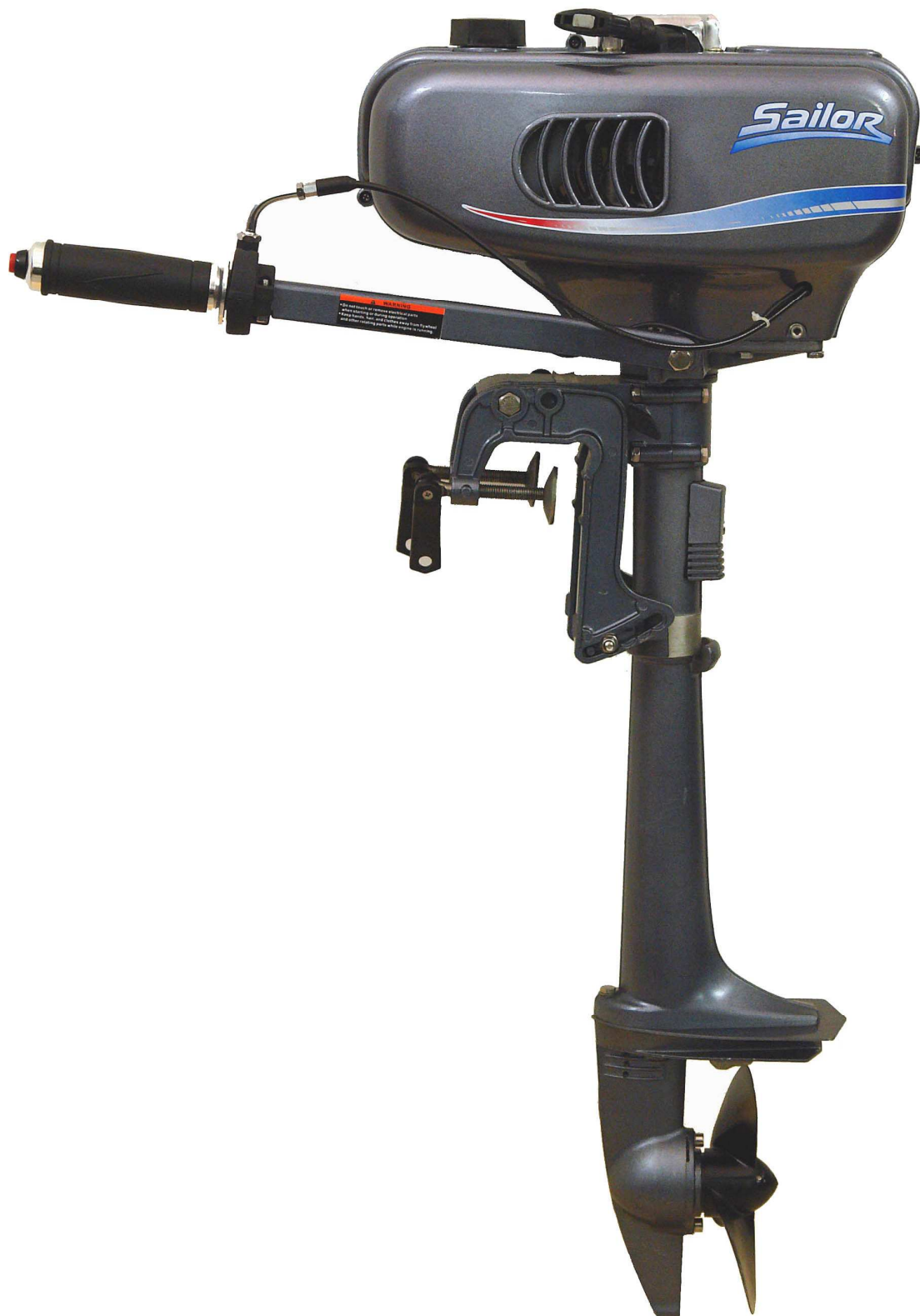
Мотор лодочный “Sailor GM 2.0HP” 2,0 л.с. Инструкция. Руководство по эксплуатации.