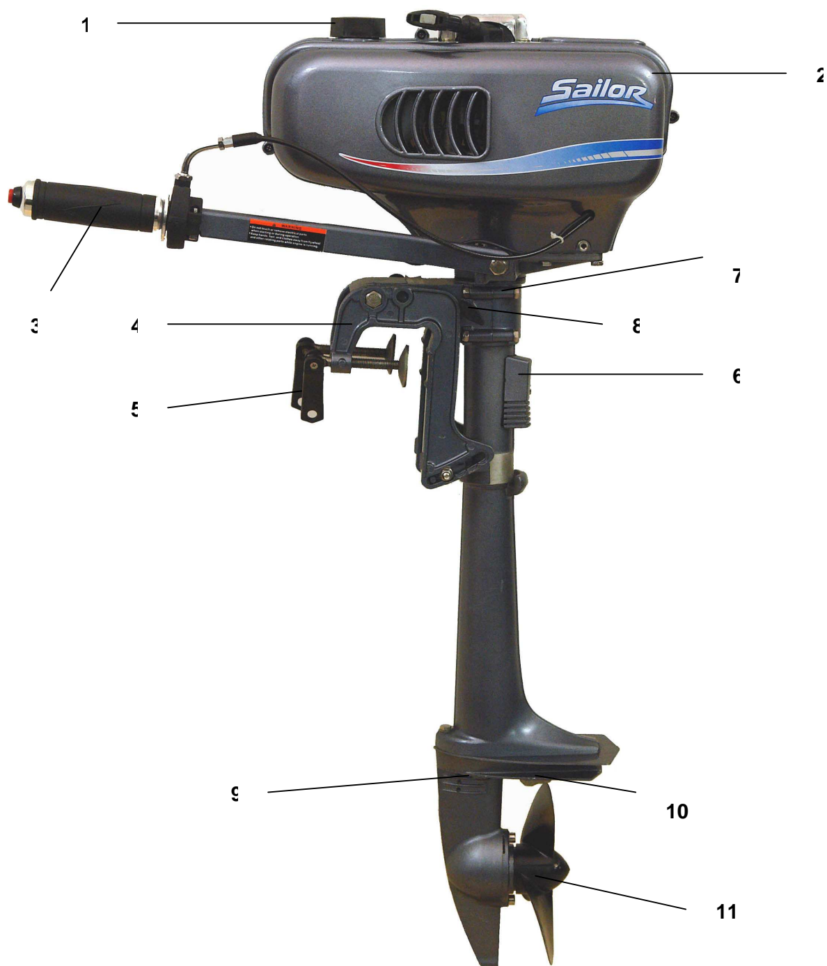
Рис.1. 1.Крышка топливного бака. 2.Защитный кожух мотора. 3.Ручка управления. 4.Скоба крепления к транцу. 5.Зажимы транцевые. 6.Крышка глушителя. 7.Поворотный шарнир. 8.Фиксатор. 9.Водозаборный канал. 10.Антикавитационная пластина. 11.Гребной винт.