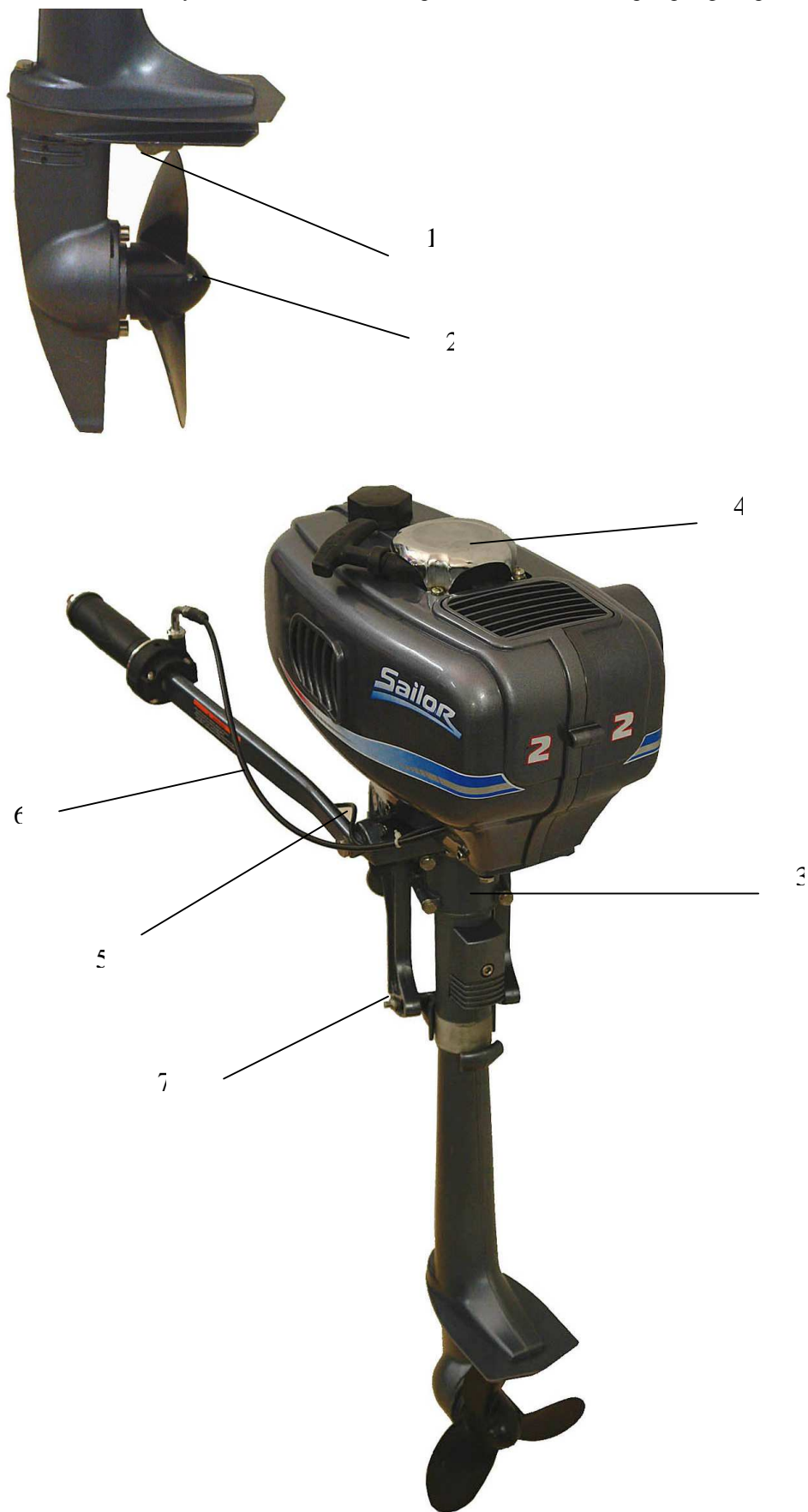
Рис.4-5. 1.Анод. 2.Винт-шпонка срезной. 3.Кронштейн крепления поворотный. 4.Кожух стартового шнура. 5.Кабель СТОП кнопки. 6.Трос управления дросселем. 7.Регулировка угла наклона мотора.