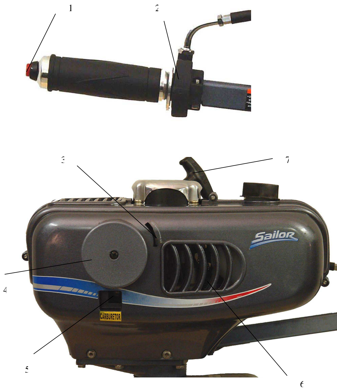
Рис.2-3. 1.Кнопка СТОП. 2.Фиксатор ручки управления. 3.Рычаг управления заслонкой карбюратора. 4.Воздушный фильтр. 5.Насос подкачки топлива. 6.Воздухозаборник. 7.Стартовый трос