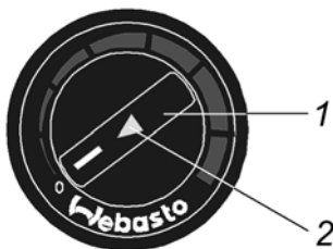
Рис. 8.1. Переключатель управления воздушным отопителем: 1 – ручка; 2 – индикатор работы отопителя

Примечание. Устройство и особенности эксплуатации воздушного (автономного) отопителя, его возможные неисправности, техническая характеристика и гарантийные обязательства приведены в инструкции (руководстве) на воздушный отопитель, прикладываемой к автомобилю.